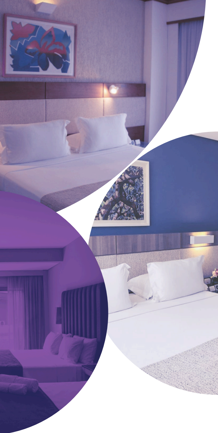
Tabela de Valores da Hospedagem

Confira as tarifas em apartamentos single e duplo!